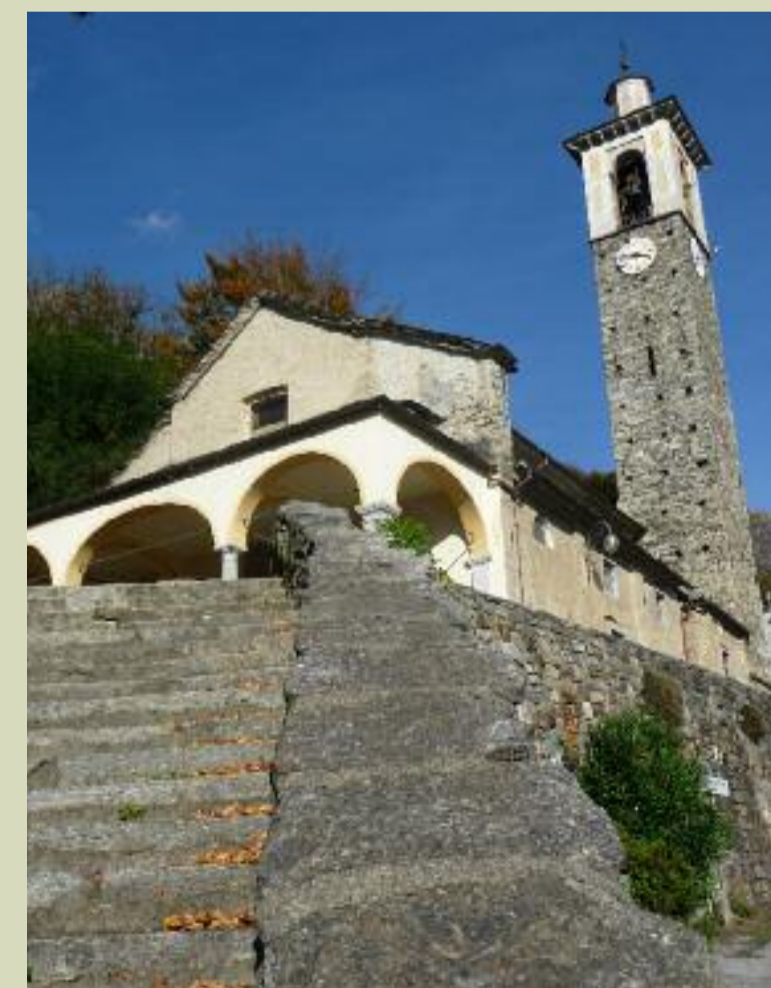
San Gottardo church in Colloro. L'église de Saint Gottardo à Colloro.